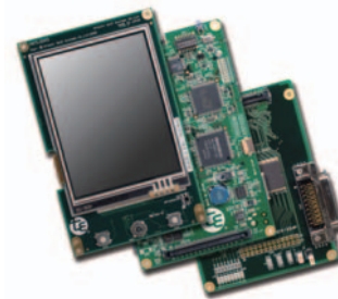
写真1: T-Engine/SH7727開発キットのボード構成